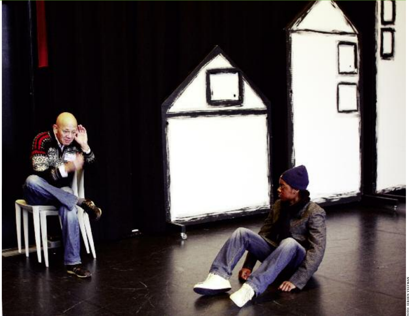
Open dag van De Acteerschool Rotterdam

Toch moest het, nóg een opleiding – zelfs al is die nog niet geaccrediteerd, zelfs al is er een over-