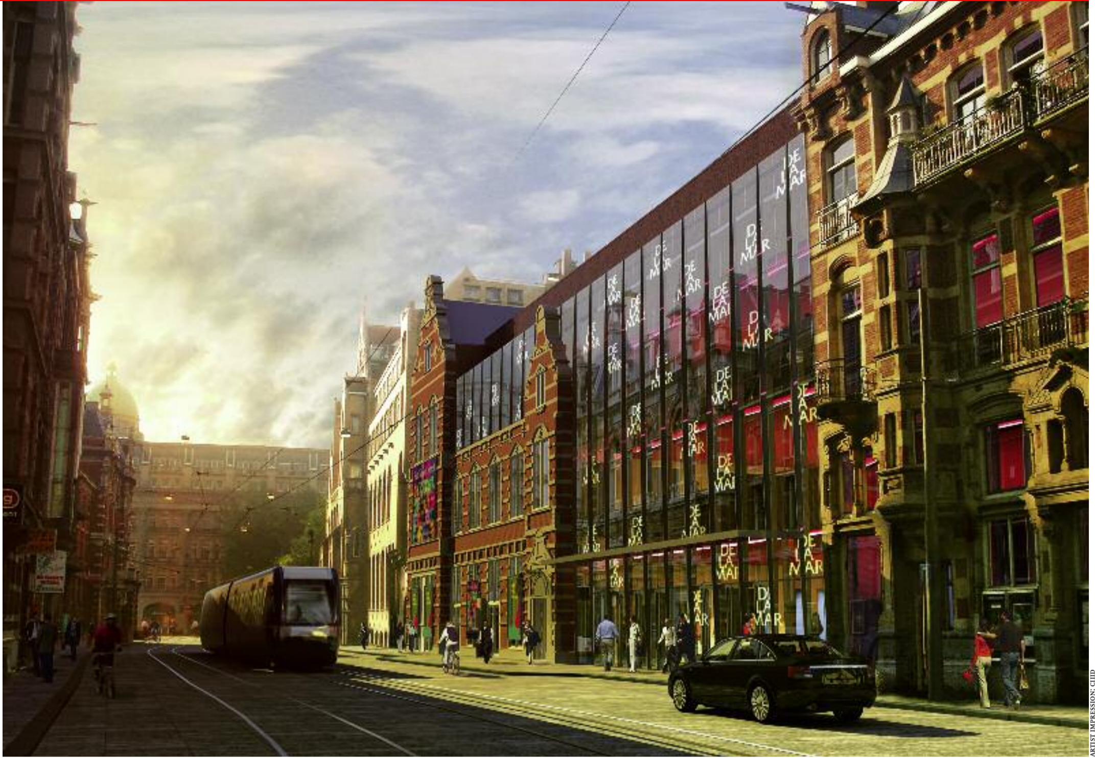
Artist's impression DeLaMar Amsterdam

zouden we de buitenlandse gast een arrangement kunnen aanbieden met internationale voorstellingen: dans, muziek en musical. Bij toneel valt te denken aan boventiteling.'