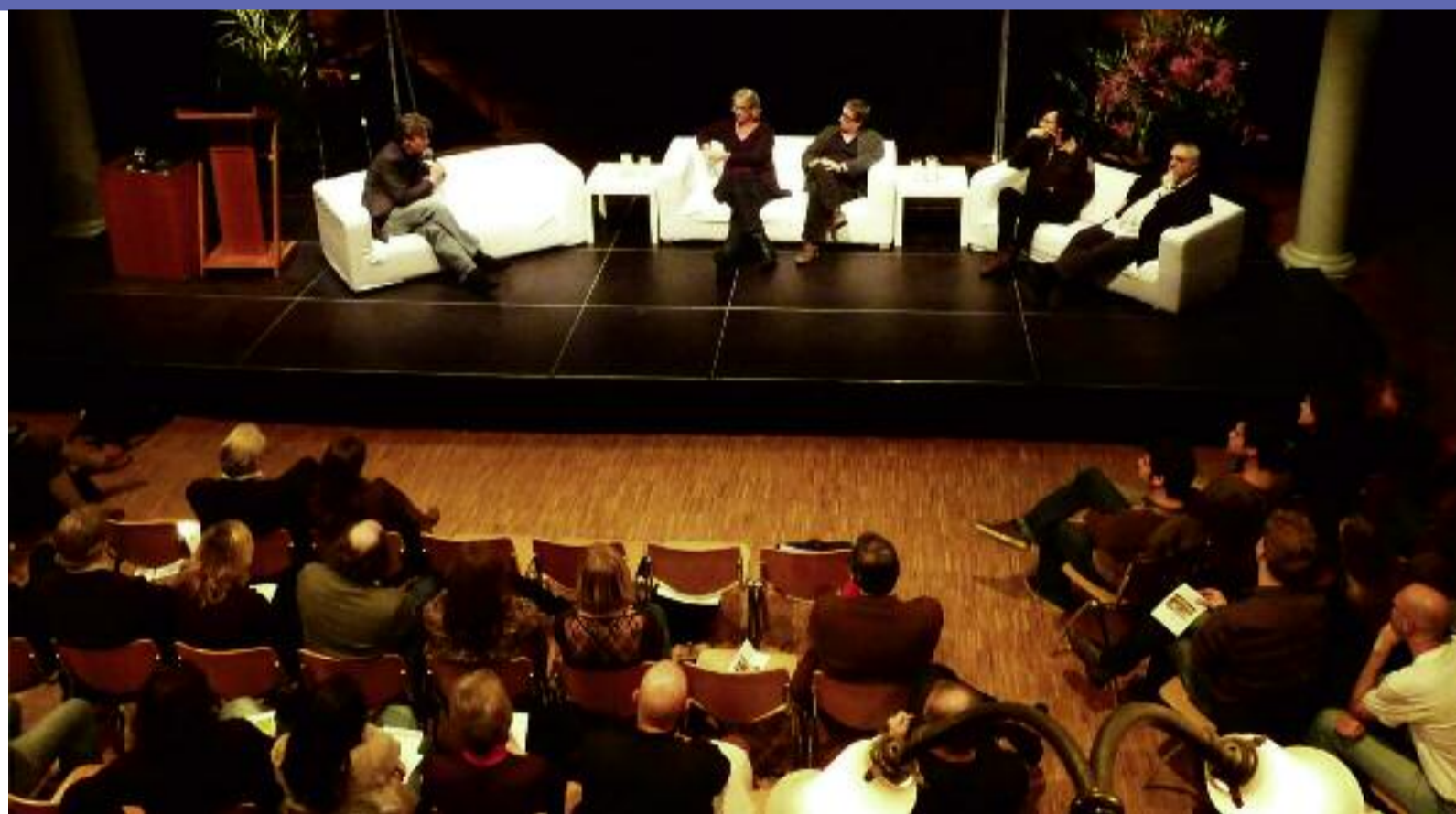
Symposium 'Eens was Aristoteles...' in de Rode Hoed in Amsterdam

Capteyn vertelt dat de epische dramaserie complexer is dan de klassieke vertelling. 'Vanwege de omvang en het ontbreken van een verfijnd begrippenapparaat staat de dramatheorie nog in de kinderschoenen. De meesterwerken van