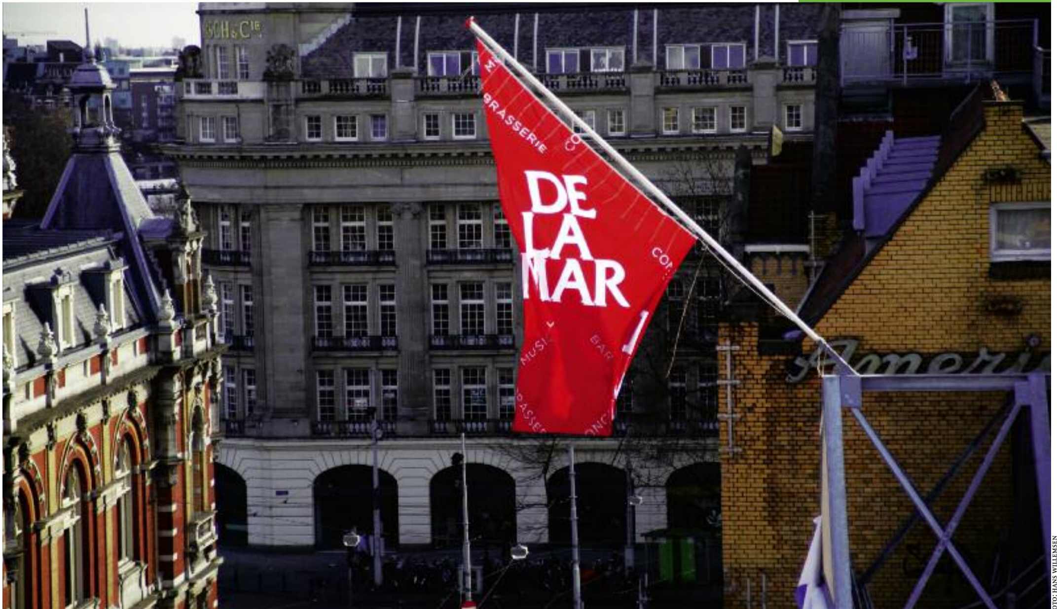
Volgens traditie werd de vlag gehesen in het hoogste punt van het DeLaMar Theater