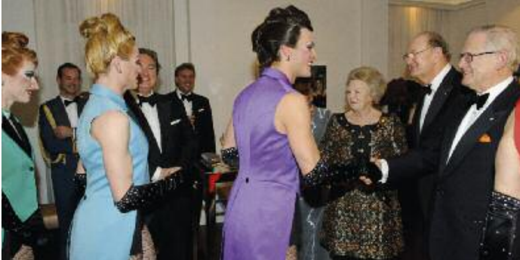
De 'girls' uit de openingsvoorstelling La Cage aux Folles

Koningin Beatrix onthult beeltenis van actrice Mary Dresselhuys