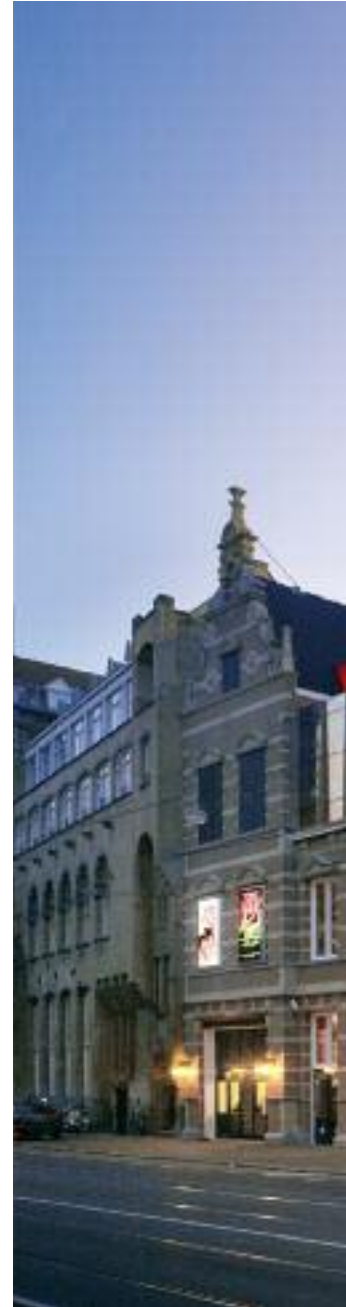
DeLaMar Theater Amsterdam

Door Fuchs raakten Joop en Janine ook in gesprek met het bestuur van de Karel Appel Foundation over de mogelijkheid een kerncollectie van Karel Appel in hun kunsthuis op te nemen. Joop van den Ende kende het Picasso Museum in Parijs. Hij vond een museum voor één kunstenaar eigenlijk te eendimensionaal. Maar hij achtte het voorstel waardevol genoeg om verder te onderzoeken. Als locatie werd gedacht aan de Zuid-As, de stedelijke uitbreiding aan de zuidkant van Amsterdam.