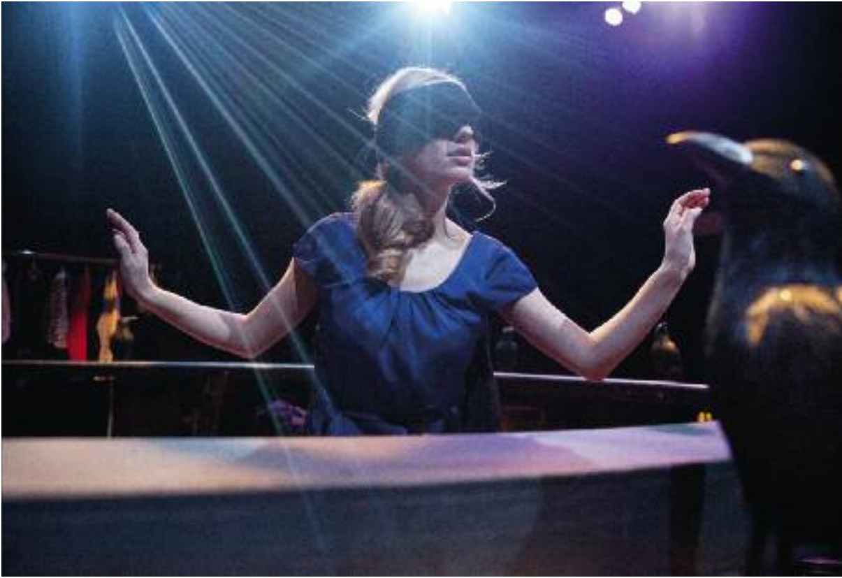
M-Lab, Krabat - Meester van de Zwarte Molen