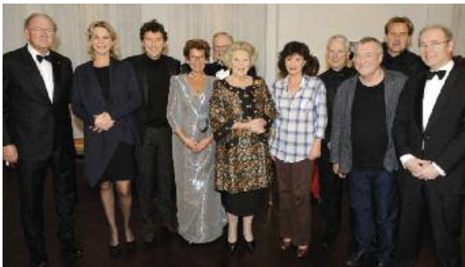
Koningin Beatrix met o.a. acteurs en producenten van Ontrouw