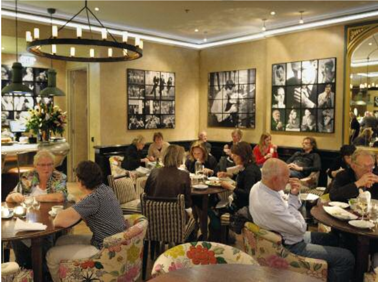
Grand Café DeLaMar