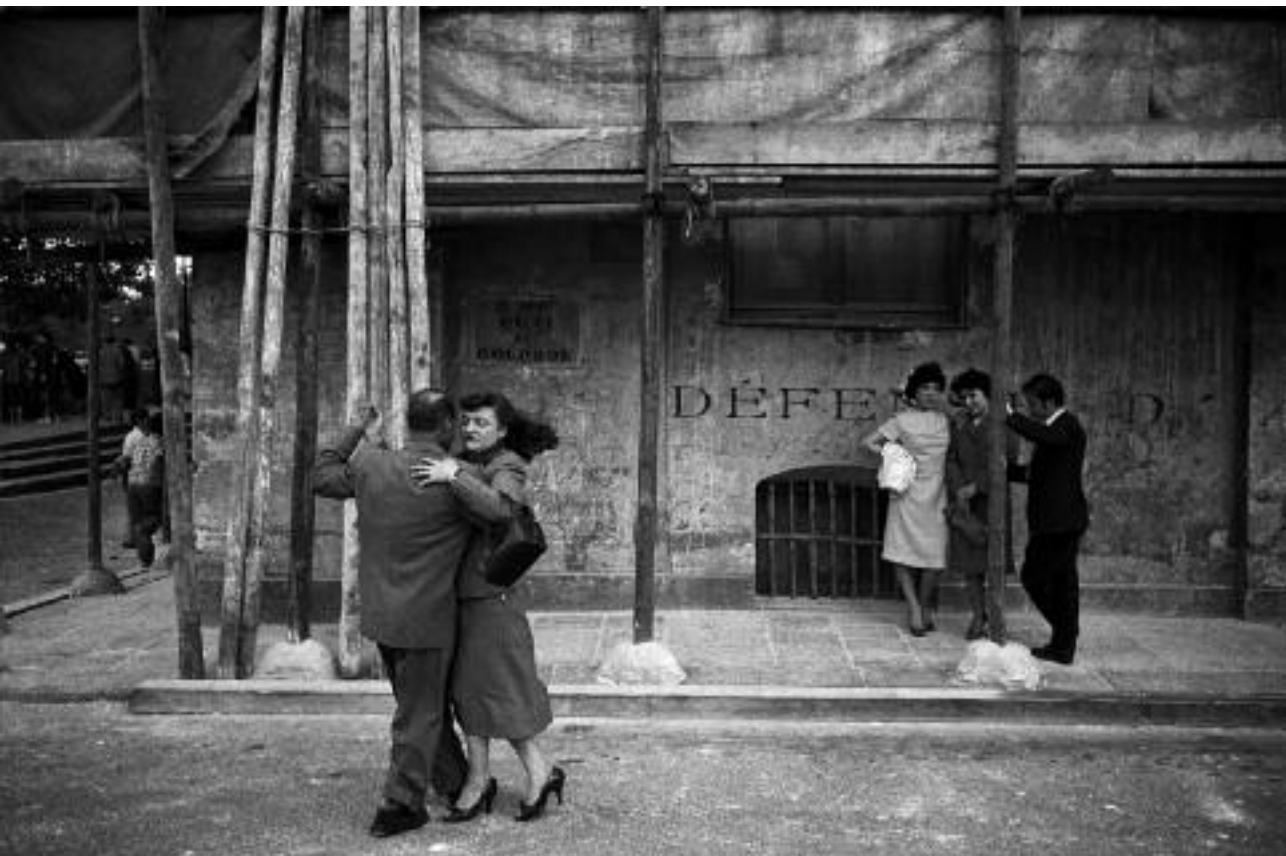
Johan van der Keuken, Quatorze Juillet Paris , 1958